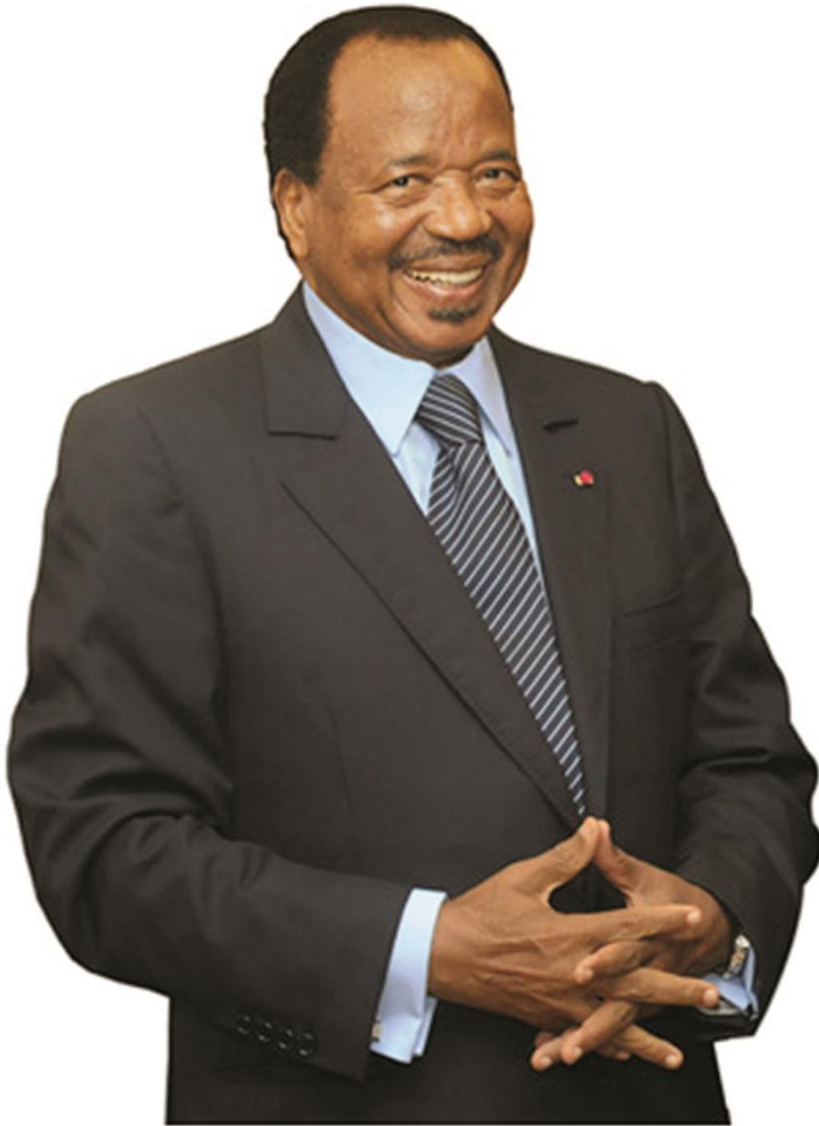
S. E. M. PAUL BIYA PRESIDENT DE LA REPUBLIQUE DU CAMEROUN