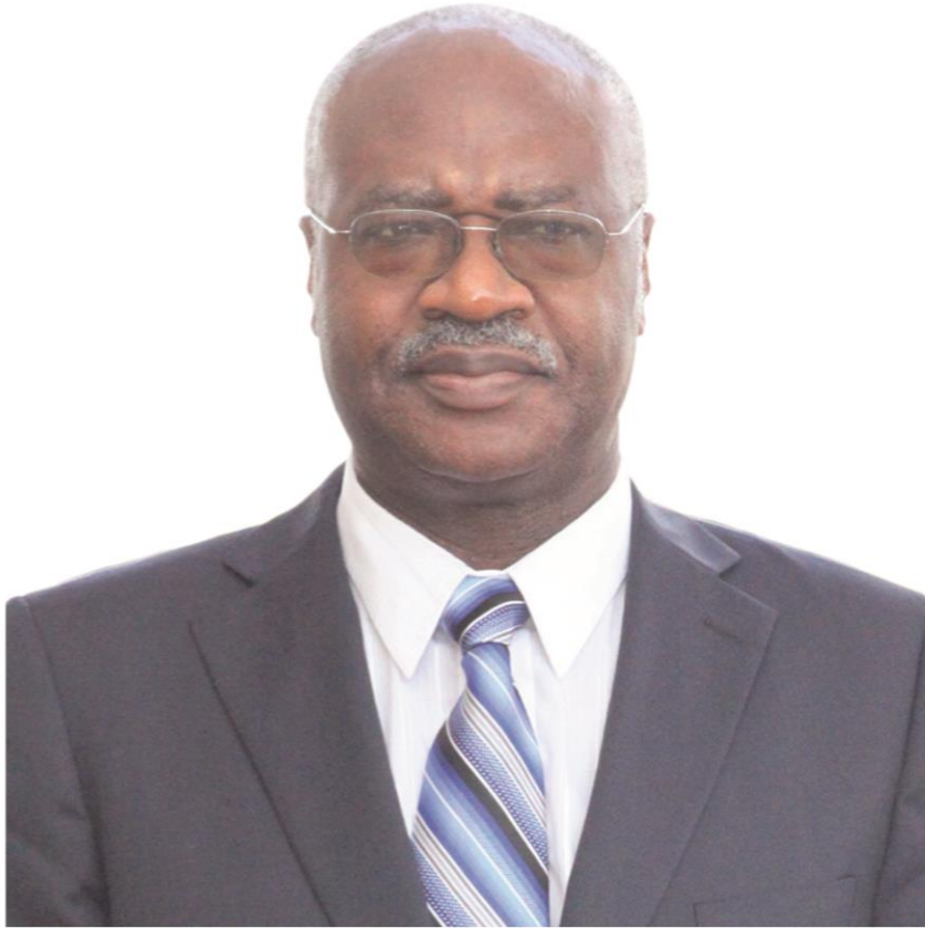
M. Philémon YANG PREMIER MINISTRE, CHEF DU GOUVERNEMENT