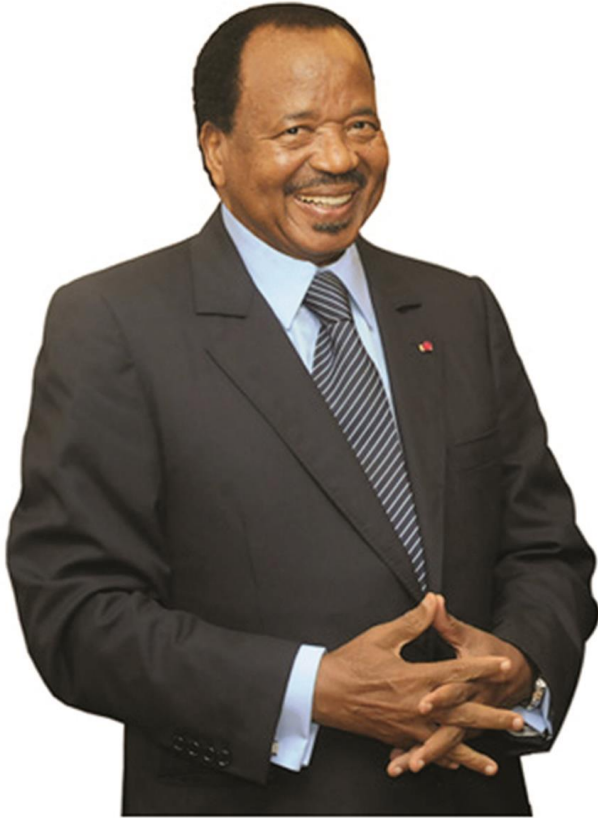
S. E. M. PAUL BIYA PRESIDENT DE LA REPUBLIQUE DU CAMEROUN