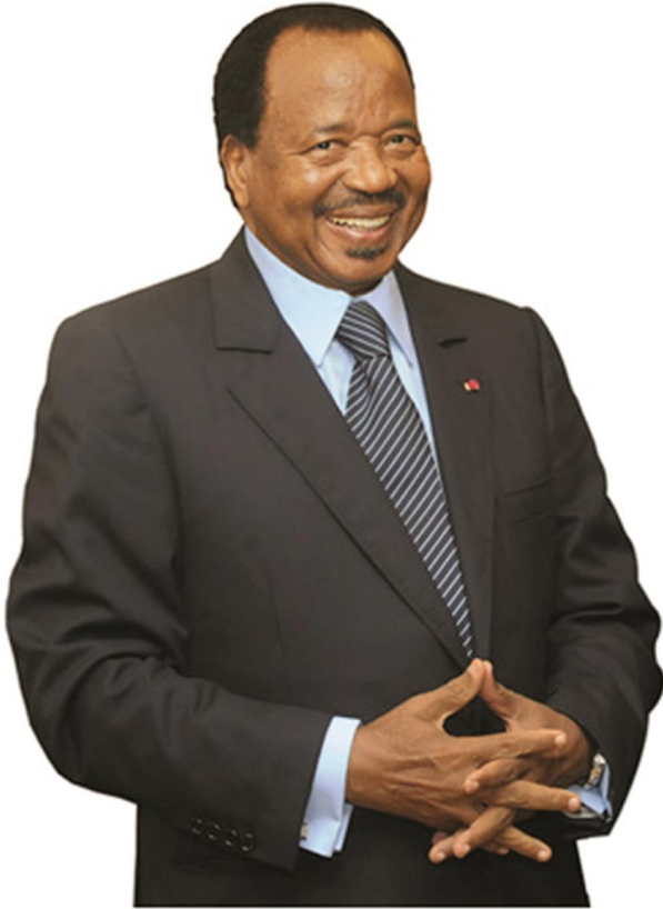
S. E. M. PAUL BIYA PRESIDENT DE LA REPUBLIQUE DU CAMEROUN