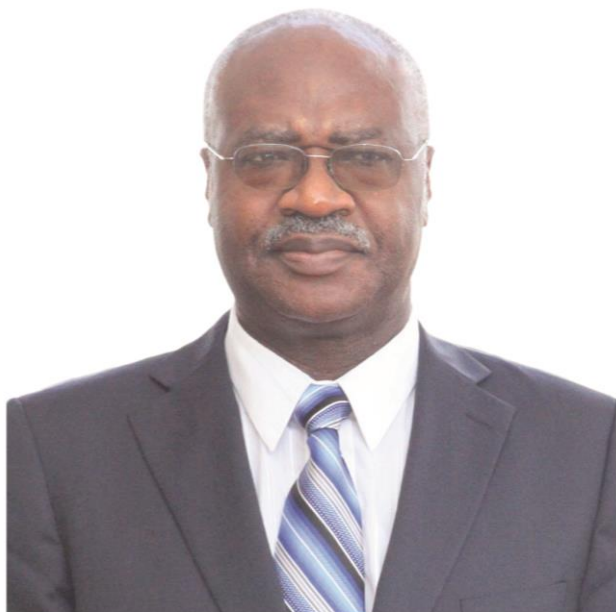
M. Philémon YANG PREMIER MINISTRE, CHEF DU GOUVERNEMENT