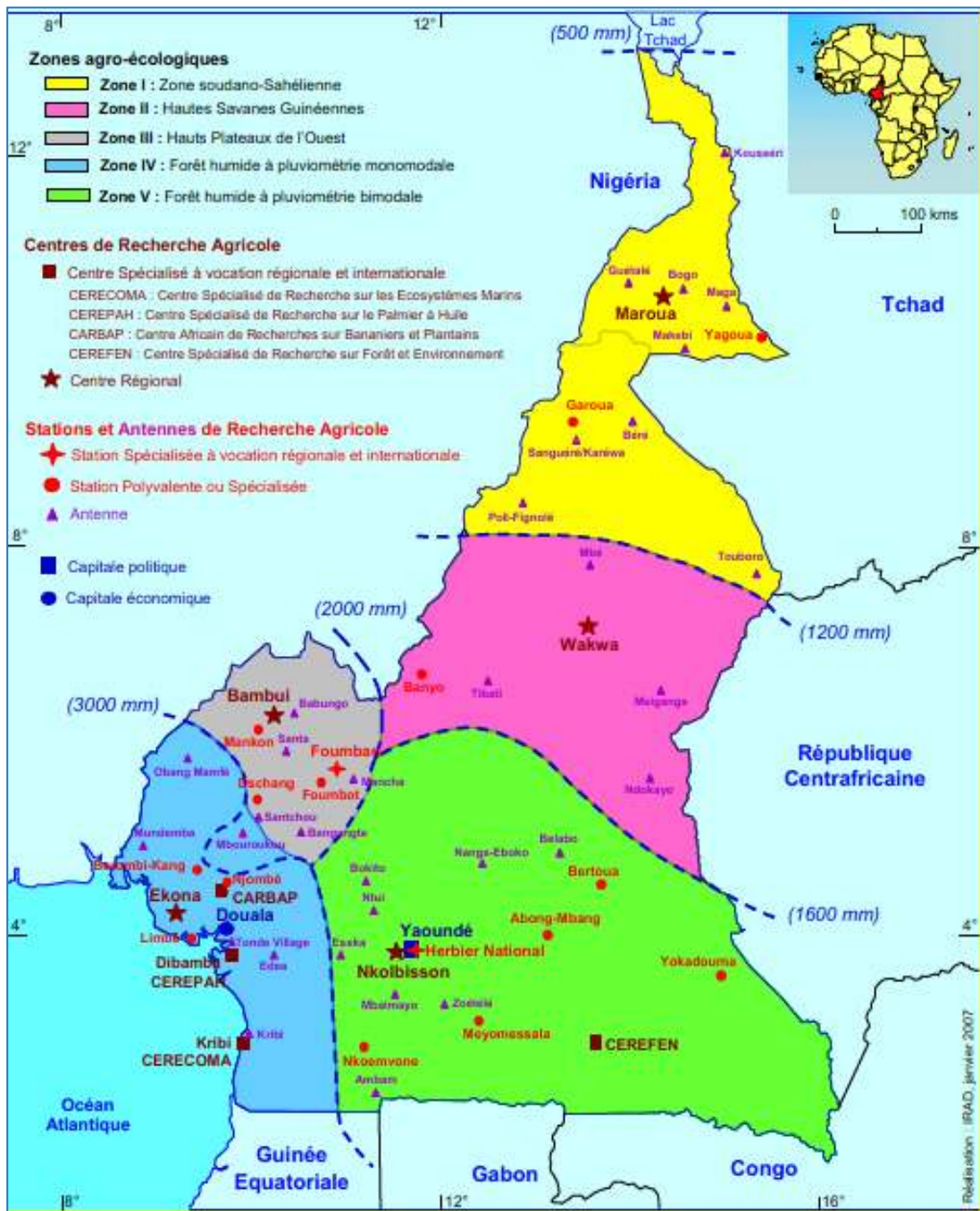
Figure 1:Zones agro-écologiques du Cameroun